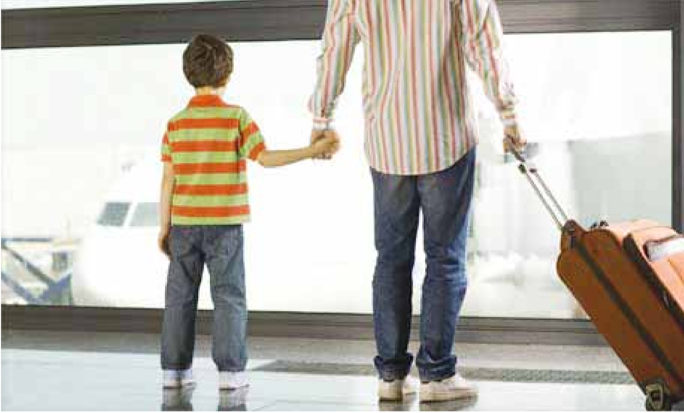
صورة من الواب

تونس - آخر خبر - روبرتاج - اعداد نسرين رمضان