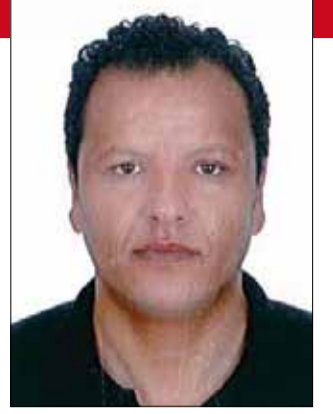
بقلم : نبيل البكري باحث دكتوراه في علم النفس

ما من حالة ثورية حقاً إلا حالة ما قبل الثورة ، عندما ينخرط الناس في العبادة المزوجة للمستقبل و للهدم. إيميل سيوران