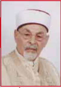
بقلم د. الشيخ محمد علي كيو