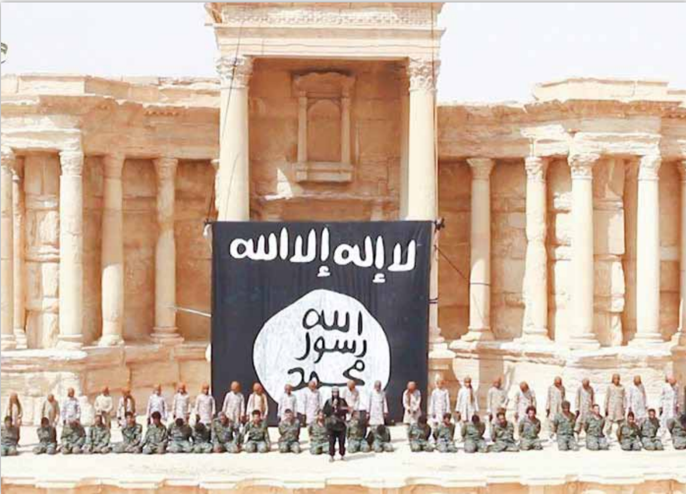
صورة نمطية للدعاية الداعشية تنسخ التجربة "الغوبلزية" في الدعاية النازية

99 كانت مجموعة «أفريقية للإعلام» تنشر إصدارات التنظيمات الإرهابية المرتبطة بالقاعدة في أفريقيا على شبكة «تويتر» إلا أن هذا الذراع الإعلامي «الجهادي» سرعان ما اظهر تعاطفه مع تنظيم «داعش» الإرهابي.